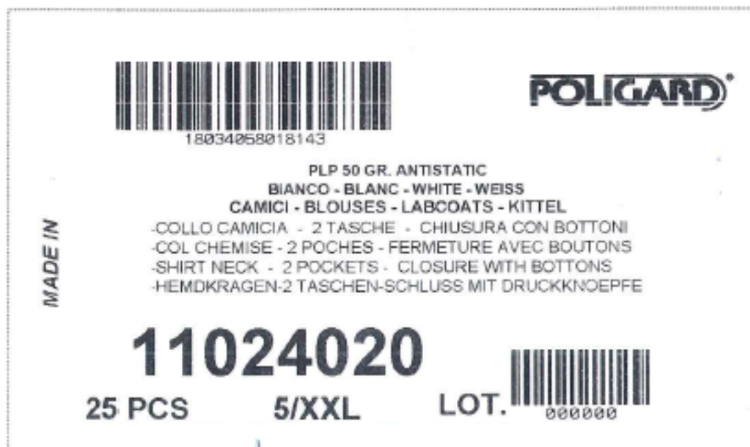
Etichetta per cartone